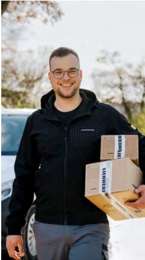
Vertrieb und Service