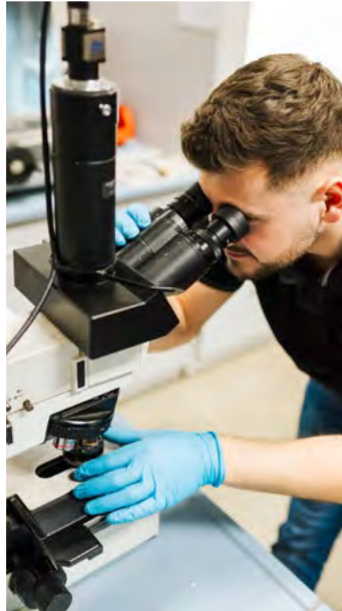
Entwicklung und Konstruktion

Die Bündelung all dieser Kompetenzen ist Basis für die stetige Weiterentwicklung unseres Angebots.